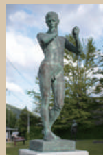
彫没学生記念碑 「わたつみの声」 1982年 1950年 本郷新記念札幌彫刻美術館蔵

本当の彫刻のあり方を社会的空間のなかにも求め、戦後日本の野外彫刻を牽引した生涯と、設置作品が破壊された2つの出来事から、社会と彫刻の関係を考えます。 ※この回は、記念館のアトリエスペースで実施します。