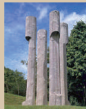
《四つの風》 1986年 札幌芸術の森野外美術館蔵

木に宿る声を聴き制作を続けた北海道を代表する彫刻家。なぜ屋外に設置した作品が朽ちていくことを敢えて受け入れたのかを考えます。