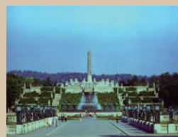
ヴィーゲラン公園(オスロ、ノルウェー)

オスロに大彫刻公園をつくりあげた彫刻家。その背景にあった市民の熱狂的な支援と、時代が移り変わっても愛され続けるものを求めた姿勢を紹介。札幌芸術の森野外美術館にも5点の彫刻が設置されています。