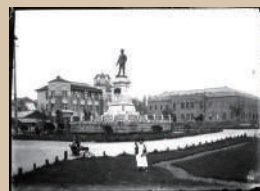
永山武四郎将軍像 1909年 札幌大通公園3丁目(1935年撮影)

日本の野外彫刻の歴史をたどり、その魅力を紹介するとともに、公共空間だからこその課題や問題点をさまざまな事例を挙げながらみていきます。