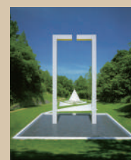
《眠られた庭への道》 1992-99年 札幌芸術の森野外美術館蔵

世界各地にその地の特性を気づかせる作品を設置したイスラエルの彫刻家。そこでしか成立しない表現を、札幌のほか、フランス、ドイツ等の代表作により紹介します。