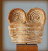
パンのモデルとなる「北方シリーズ へんな人」

美術館近隣のパンカフェ「cafe スロープ」さんのご協力により、本郷新のテラコッタ作品「北方シリーズ へんな人」がパンに変身！当日限定の「食べる彫刻」にご期待ください。