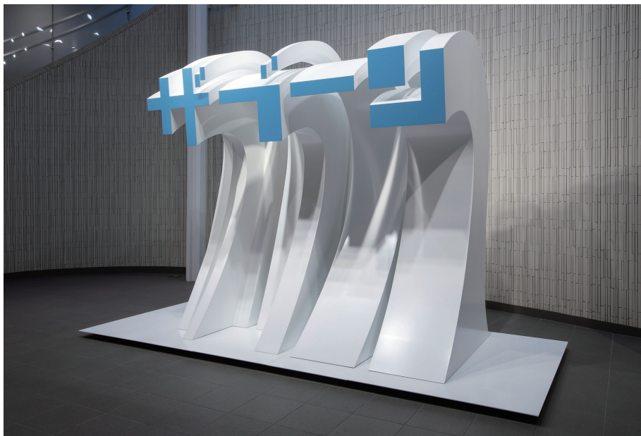
第3回本郷新記念札幌彫刻賞受賞作《ザブーン》2021年 鉄、塗料(大通交流拠点地下広場、札幌、2024年1月まで)

戦後日本の公共空間への彫刻設置を牽引した本郷新(札幌生まれ、1905-1980)の業績を記念するとともに、生前から若手作家の育成を願っていた遺志を受け、本郷新賞を発展的に継承し、2013年度に開設した賞。札幌中心部の「大通交流拠点地下広場」に3年間設置する作品を全国公募し、イメージ図や制作意図等の資料による一次選考、1/10サイズの模型作品による二次選考によって、受賞作品を決定しています。