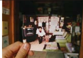
〈暮らしあと〉2009年 ビデオ

1980年札幌市生まれ、札幌市在住。 日常風景に向き合い、個人の知覚の絵画化に取り組む。