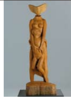
〈先生!八木田くんが迷子です〉 2009年 石膏

1977年帯広市生まれ、鷹栖町在住。 人の心のありようを異形の姿で表現した彫刻作品を手がける。