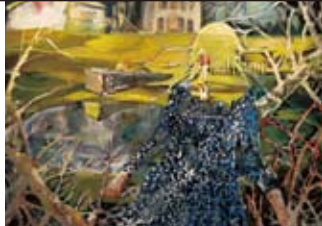
〈私の輪郭〉* 2011年 油彩、キャンバス

1967年夕張市生まれ、江別市在住。 石膏を素材に、深遠な存在感の漂う人体像を手がける。